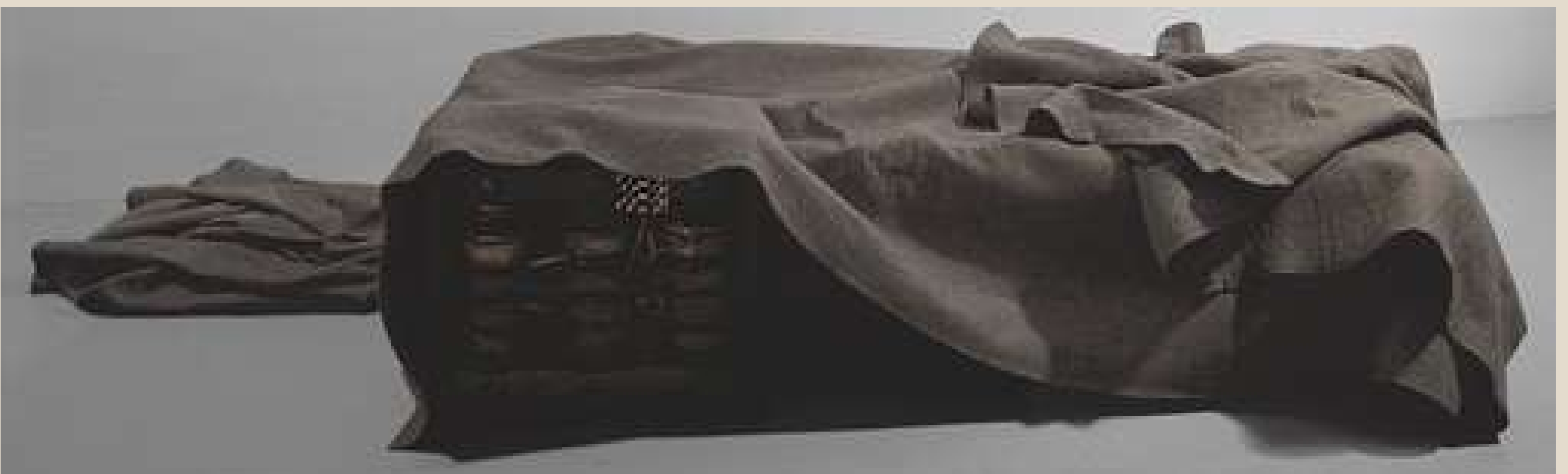
Joseph Beuys : On Multiples

Une fenêtre s'en détache. Elle laisse apparaître des êtres étranges issus de l'imaginaire de l'enfant . Une source lumineuse , évoquant la lune , viendra jouer avec cet espace tamisé, prolongeant la fascination de l'enfant pour cet ailleurs inaccessible .