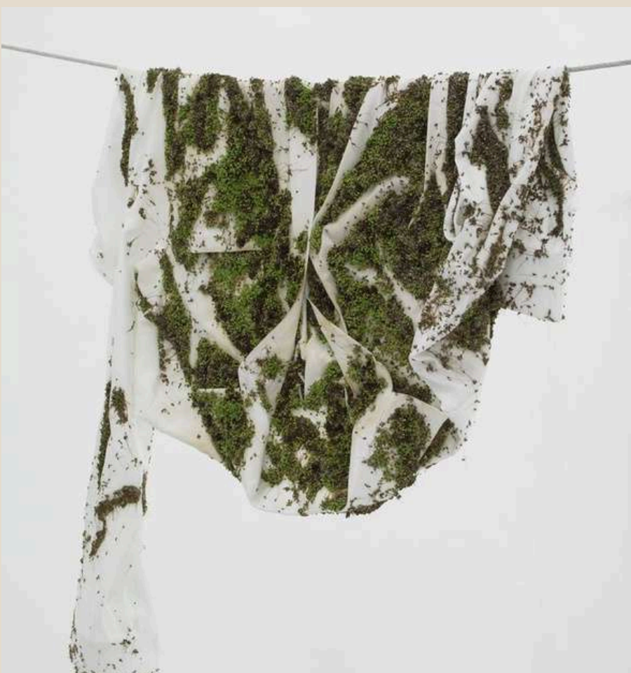
Bea Fremderman et Andrew Laumann : Machine in the garden

L' espace est bouleversé : il n'a pas disparu, mais il a changé de forme et de fonction. La maison s'efface pour laisser place à une clairière intérieure . Le plateau s'ouvre. L'enfant est désormais seul, face à un monde nouveau , construit à partir des mêmes éléments, métamorphosés, et de ses souvenirs. Le sol devient souche, abri, vestige. Une scène de bascule , entre disparition, réinvention et quête.